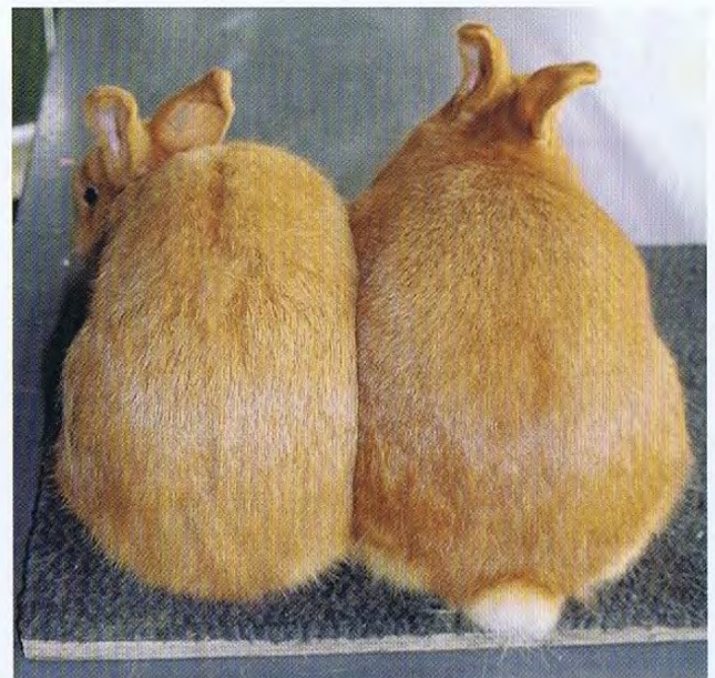
Een duidelijk verschil tussen twee dieren die allebei gebruikt worden voor de fok.