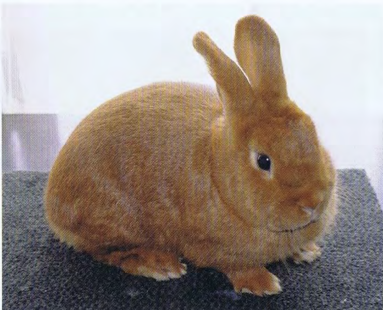
Deze fraaie oude voedster behaalde al meerdere prijzen.

Wil begint geheimzinnig te lachen als dit onderwerp ter sprake komt. "Het is een bijzondere actie geweest waar ik mijn dieren -en daardoor wij allemaal- de huidige Thrianta aan te danken hebben," vertelt Wil. "In het diepste geheim is er een ruil gedaan midden in de nacht op de Duitse erebegraafplaats in het Limburgse IJsselstein. Daar