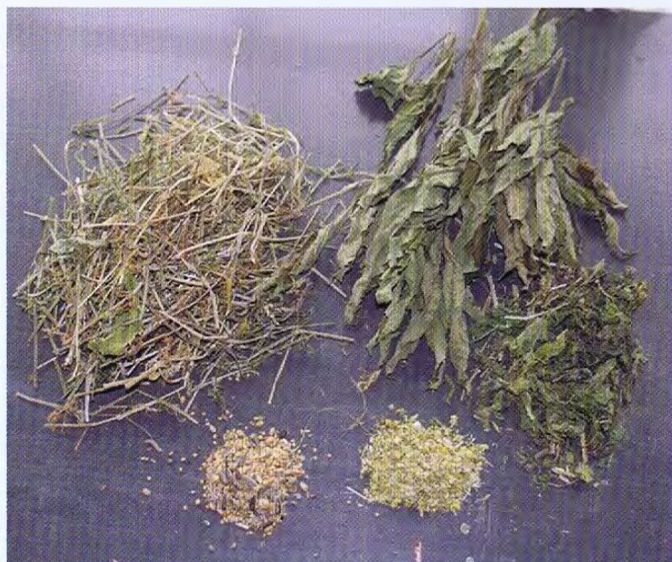
Een breed palet met gevarieerd voer waaronder hooi, topinamboer (aardpeer), kleefkruit, kamille en een zadenmix.