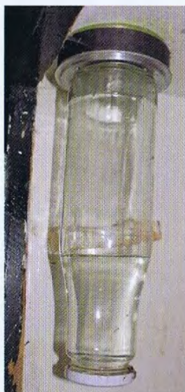
Geen standaardflesjes voor Wil, met magneten en oude flessen maak je je eigen drinksysteem.